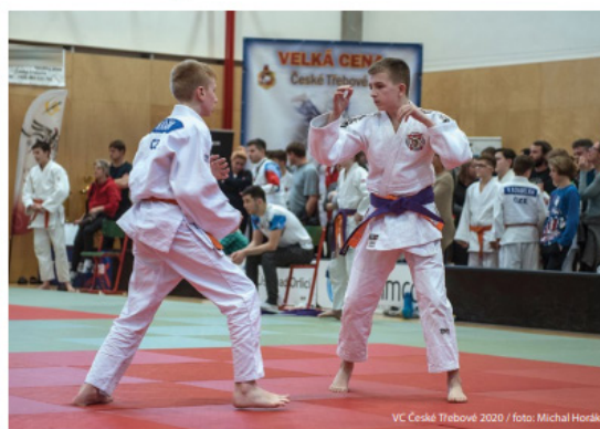
VC České Třebové 2020

Panoramatická prohlídka města vám poskytne dokonale přehled o rozložení zajímavých turistických cílů v rámci města a jeho nejbližšího okolí. V jejím rámci můžete navštívit Staré náměstí, rotundu sv. Kateřiny, kostel sv. Jakuba Většího, dopravní terminál Jana Perera, park Javorka, poutní kapli Panny Marie Pomocné na Horách, rozhlednu na Kozlovském kopci a chaloupku Maxe Svabinského.